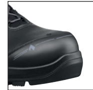
HAIX® Nano-Carbon Schutzkappe